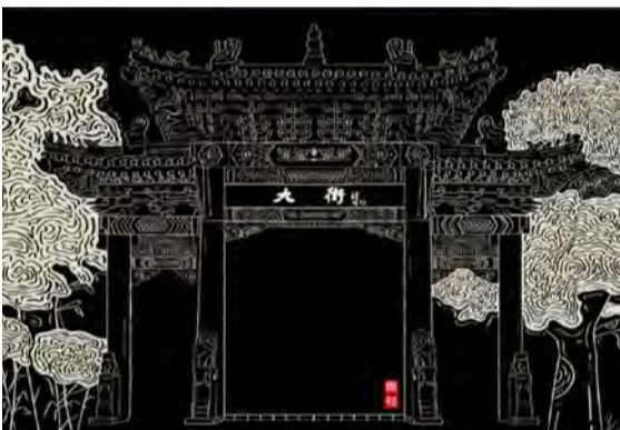
《大街》版画 学生：李尚彦 指导教师：翟倩倩