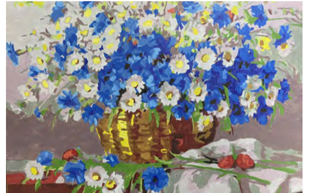
《花篮》装饰画 学生：崔荣浩 指导教师：高迅