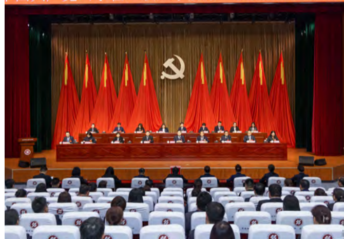
中国共产党山东轻工职业学院第二次党员代表大会