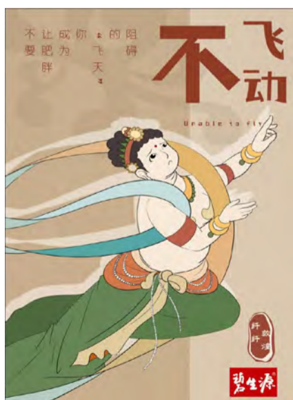
《纤纤敦煌》商业广告 学生：吕晓彤 指导教师：翟倩倩