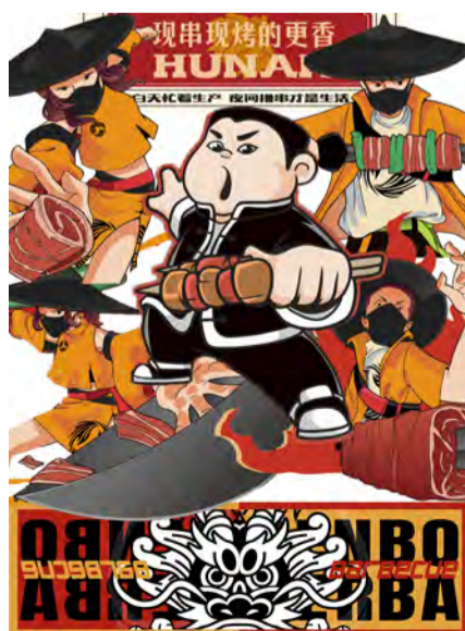
《烧烤》商业插画 学生：潘宇晨 指导教师：王庶