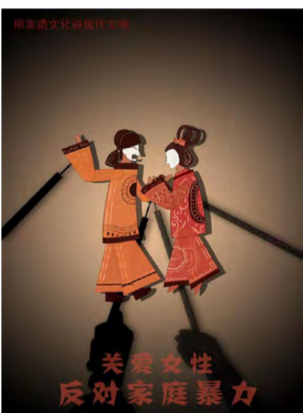
《反对家庭暴力》公益广告 学生：吕晓彤 指导教师：翟倩倩