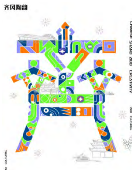
《齐风陶韵》公益广告 学生：赵舒亚 指导教师：王庶