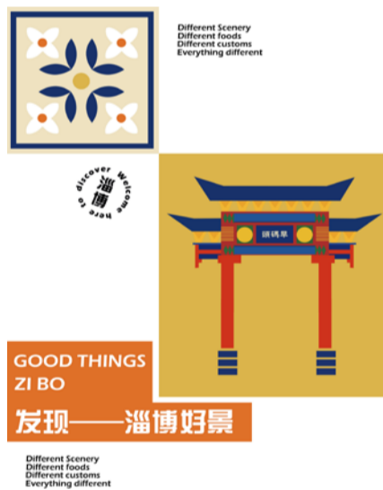
《发现淄博好景》公益广告 学生：王仲昊 指导教师：王庶