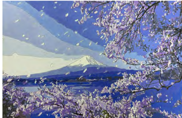
《富士山下》装饰画 学生：张硕财 指导教师：高迅