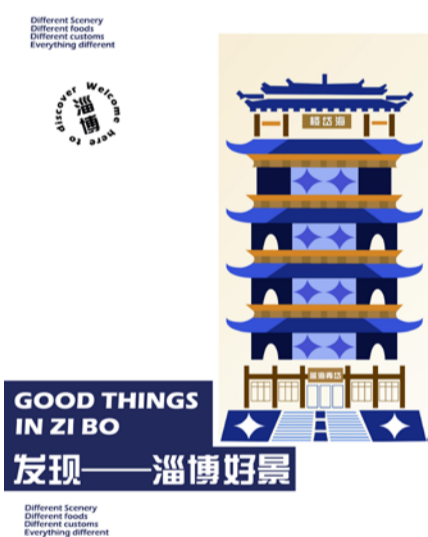
《发现淄博好景》公益广告 学生：王仲昊 指导教师：王庶