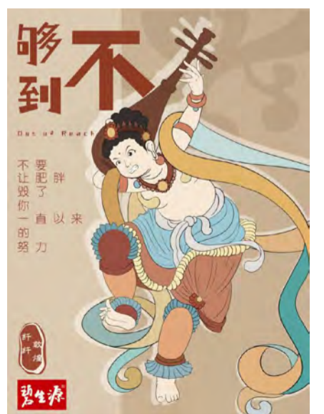
《纤纤敦煌》商业广告 学生：吕晓彤 指导教师：翟倩倩