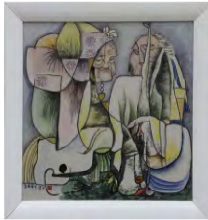
《聊斋故事》刻瓷板 李苦